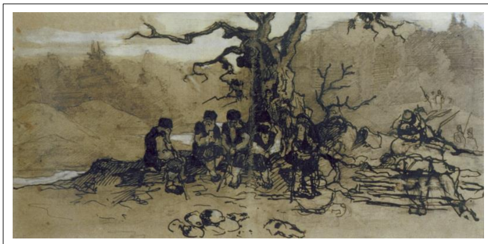
Н.К. Рерих. Сходятся старцы. 1898. Эскиз.

«В настоящее время усиленно работаю над картиной с самым археологическим древнеславянским содержанием...»