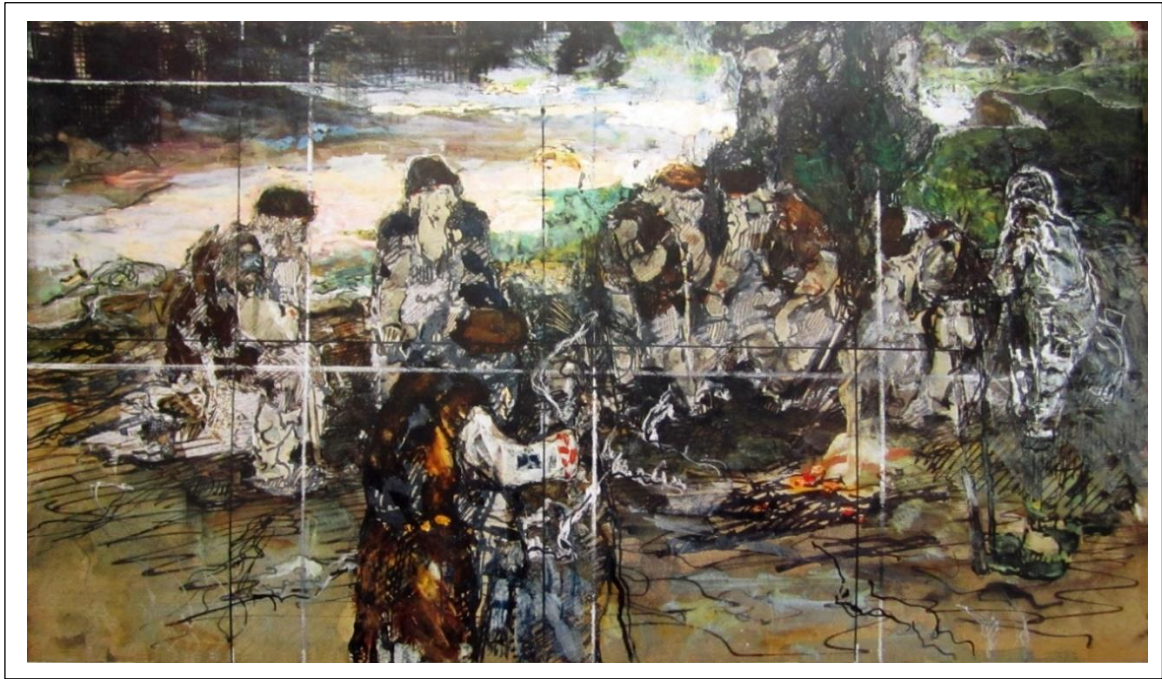
Сходятся старцы. Эскиз к картине. 1898.