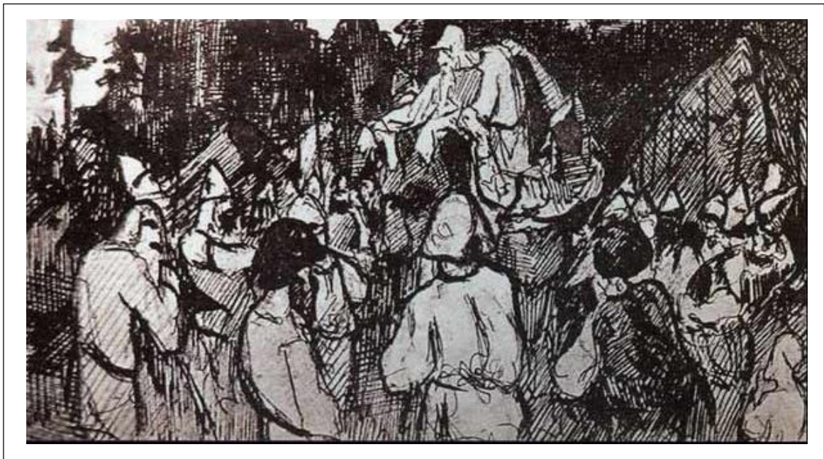
Фигуры старцев. Наброски к картине «Сходятся старцы». 1898.