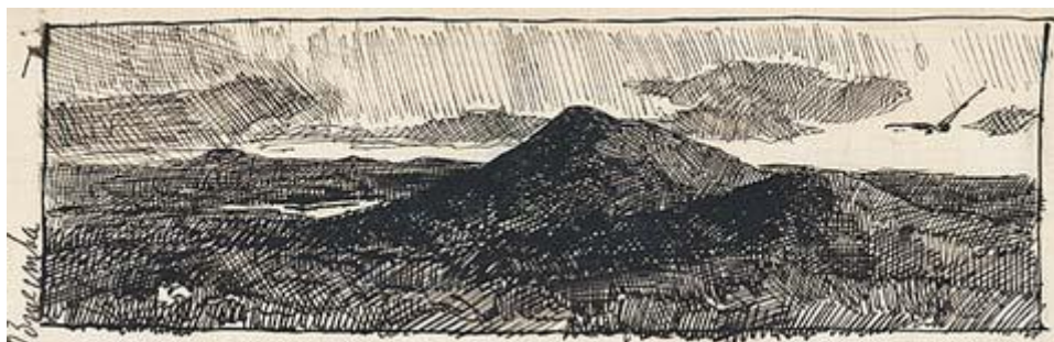
Н.К. Рерих. Курганы. 1890-е.